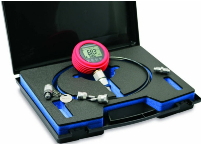
LR SK 01 Digitale Hydrauliek Service kit

Word compleet in draagkoffer geleverd Manometer voorzien van logger optie.